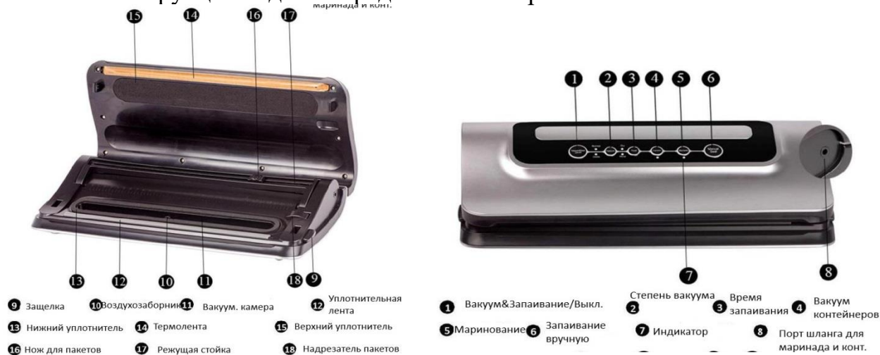
Рисунок 1 – Конструкция и назначение органов управления вакууматора Sea-Maid

2.1 Конструкция изделия представлена на рис. 1.